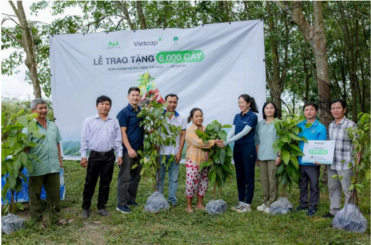
Hình ảnh Lễ trao tặng cây giống và trồng cây của VietCap